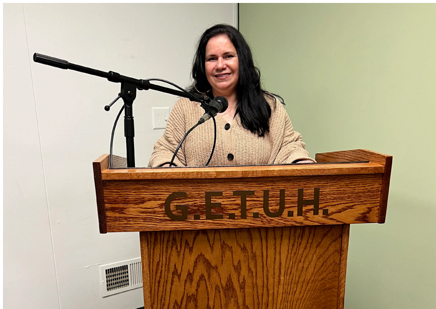
Ela é uma das expositoras da casa aos domingos

De família evangélica, ela encontrou as respostas que buscava na Doutrina Espírita