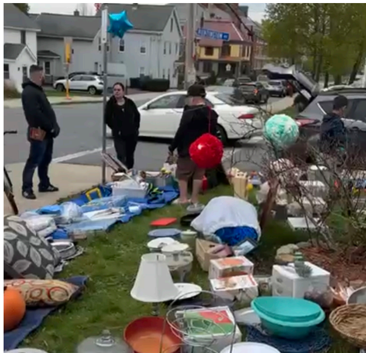
Em 2023, evento foi realizado no dia 29 de abril