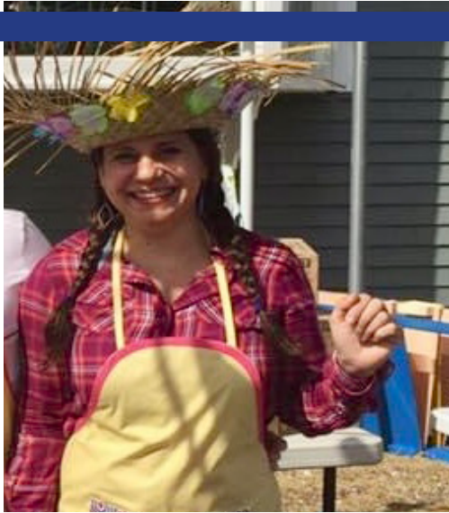
Em festa junina do Getuh em 2016