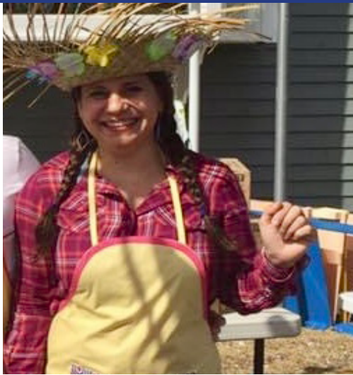
Em festa junina do Getuh em 2016