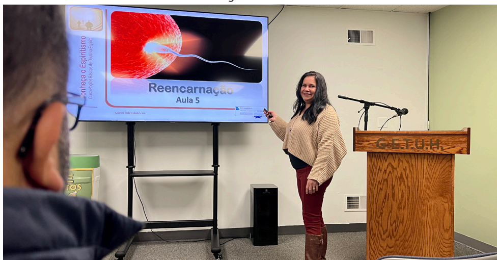
Dedicada, ela é uma das instrutoras dos cursos espíritas do grupo