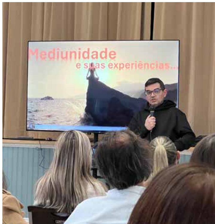
Workshop teve a participação de aproximadamente 50 pessoas

“Todo aquele que sente, num grau qualquer, a influência dos Espíritos