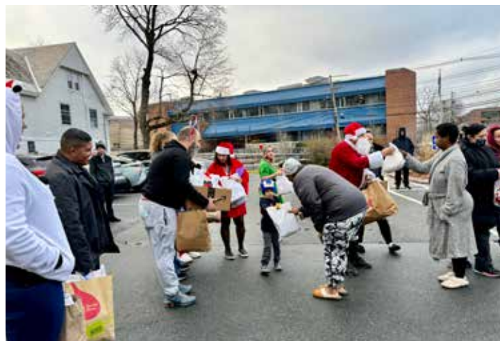
Campanha do ano passado entregou 250 sacolas de presentes

vembro no próprio Getuh em dias e horários das reuniões públicas, que ocorrem toda terça-feira, das 19 às 21 horas; e aos domingos das 10h30 às 12h30; além de quintas-feiras, das 19 às 21 horas, quando ocorre o Atendimento Fraternal.