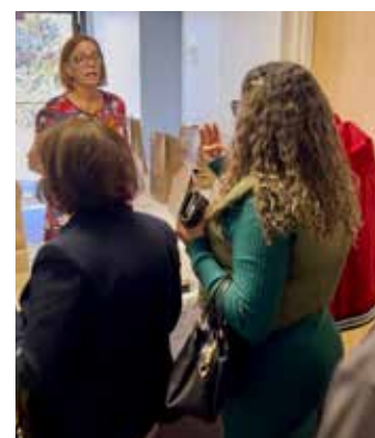
Cantina teve almoço especial

No próximo ano os médiuns estarão de volta para mais uma temporada de trabalhos nos Estados Unidos, sempre abertos a levar palestras e cirurgias espirituais a novas casas espíritas no país.