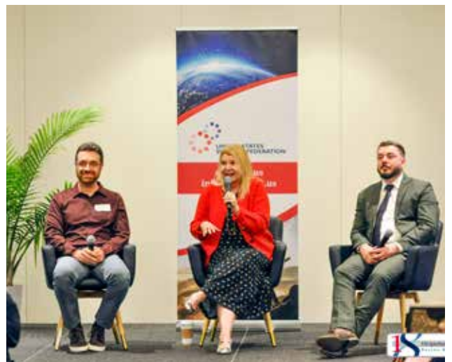
Evento nacional foi realizado em setembro. Página 8